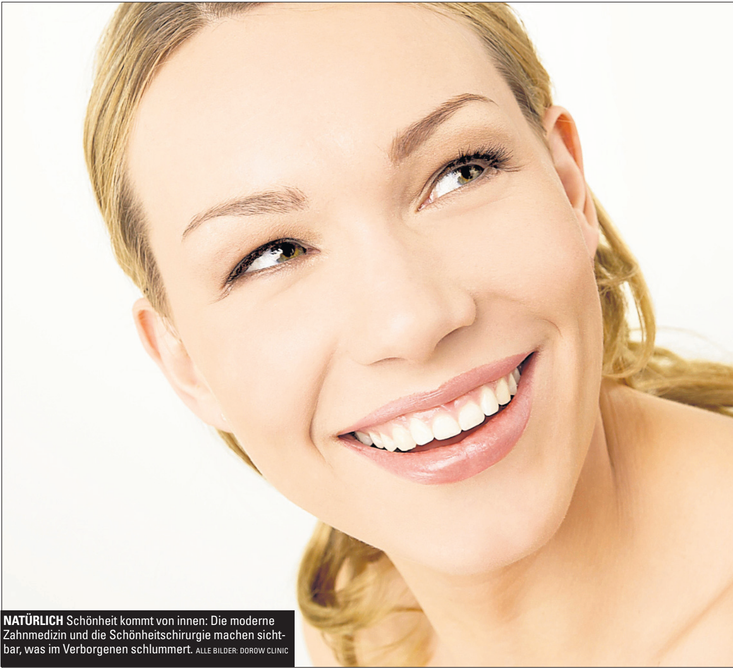
NATÜRLICH Schönheit kommt von innen: Die moderne Zahnmedizin und die Schönheitschirurgie machen sichtbar, was im Verborgenen schlummert.